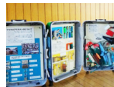
漂着物のトランク・ミュージアム® 対馬版 (対馬 CAPPA 協力)