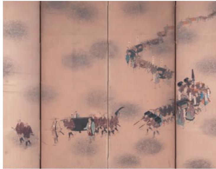
1 다이슈 토산물 목록(에도시대 1781년) / 2 옥칠 월성문 함(에도시대 19세기) / 3 윤가이도치쿠 초상(에도시대 1716년) / 4 이테이안 윤번승 다이슈 하행행렬도 병풍(에도시대 19세기)

쓰시마에 있었던 이테이안(以酏庵)은 교토 오산(5대 사찰)에서 윤번으로 파견된 선승이 조선과의 외교 문서를 취급하는 외교 기관이었습니다. 교토에 있는 료소쿠인은 임제종 건넌지파 탐두사원으로 이테이안에 윤번승을 파견했습니다. 료소쿠인에는