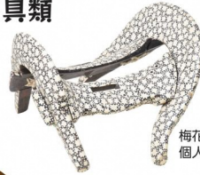
梅花皮写象牙張鞍 個人蔵