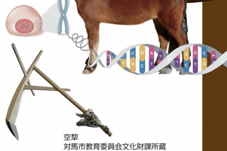
空犁 対馬市教育委員会文化財課所蔵