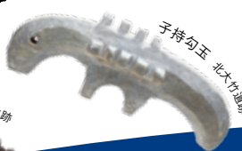
子持勾玉 北九州遺跡