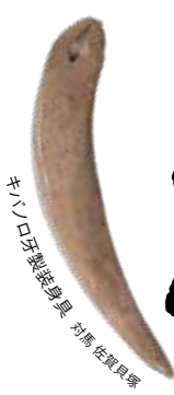
キハコ牙製装身具 対馬 佐賀貝塚