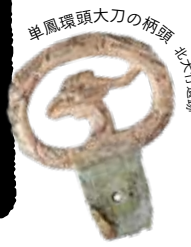
単鳳環頭大刀の柄頭 北九州遺跡