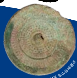
珠文鏡 対馬 島山跡遺跡

EXHIBITION OF EXCAVATIONS IN THE JAPANESE ARCHIPELAGO