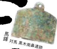
馬鐸 対馬 黒木南跡遺跡