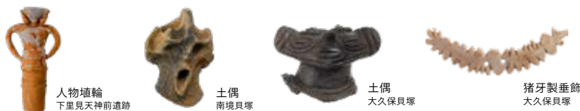
人物埴輪 下里見天神前遺跡