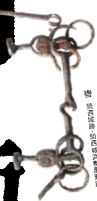
轡 騎西城跡・騎西城武家屋敷跡