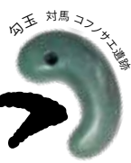
勾玉 対馬 コノサエ遺跡