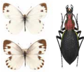
対馬産タイワンモンシロチョウ

対馬の昆虫の魅力と、日本列島と朝鮮半島の間に位置する“陸橋の島”ならではの生物多様性を紹介する。