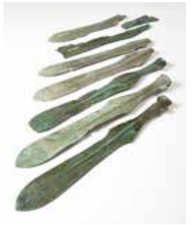
増田山遺跡出土品(弥生時代2世紀)

毎年約8千件の発掘調査が行われているが、近年研究成果がまとめられたものなど注目の出土品が全国から集結する。